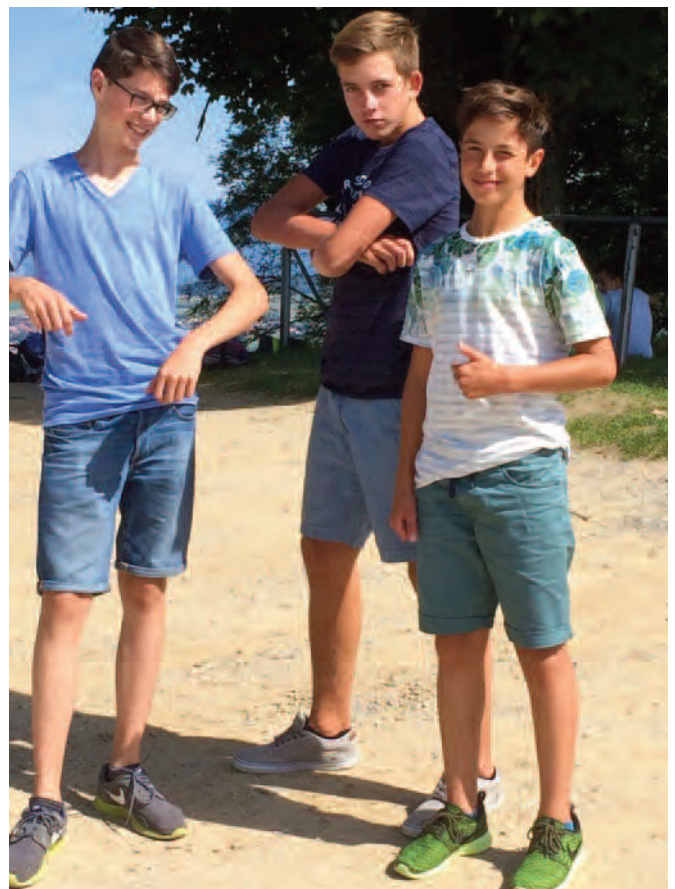
Zufriedene Jugendliche der 3A in der schönen Landschaft rund um den Murtensee