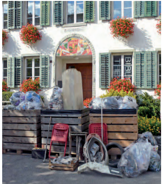
«Güsel»-Ausstellung vor dem Gemeindehaus.

«Dä Ufruum-Tag isch jetzt scho verbii, äs isch äs bsundrigs Erläbnis gsii! CLEAN UP, CLEAN UP, CLEAN UP»