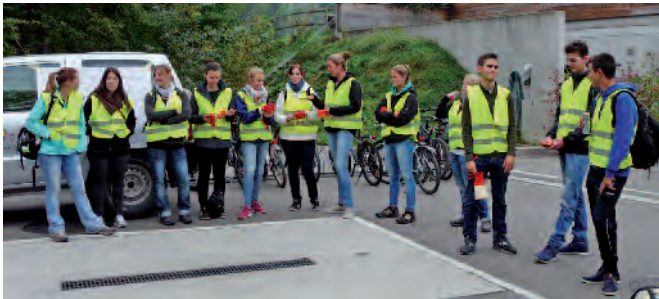
Der Turnverein und der Cevi haben am Samstag fleissig Abfall gesammelt.