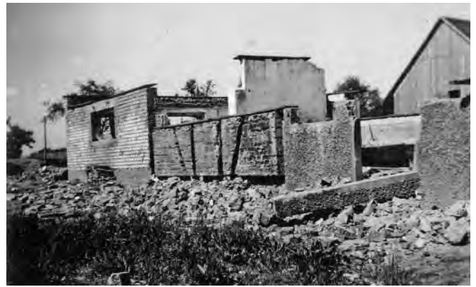
Brandruine auf dem heutigen Gärtneriareal, 1934