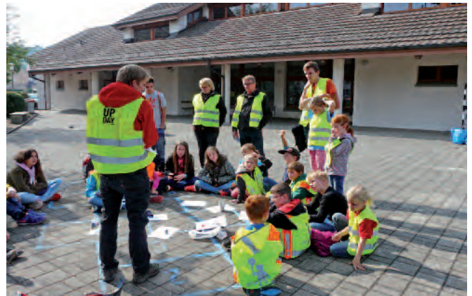
Thomas E., Mitarbeiter des Naturzentrums Thurauen erklärte anhand von Beispielen, wie lange es dauert, bis etwas achtlos Weggeworfenes abgebaut wird: zum Beispiel dauert es fünf Jahre bis ein Kaugummi «verschwunden» ist...

MI 10. 19 Uhr Aschermittwoch Gottesdienst kath. Kirche Pfungen