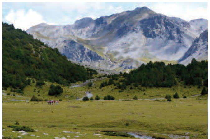
Landschaftlich imposantes Val Mora

Aus einer Arve wird ein Möbel: In Bergtälern gibt es gegenüber unserer Agglomeration Winterthur nur wenige Erwerbsmöglichkeiten. Eine ist die Holzverarbeitung. Beim Besuch einer Schreinerei gab der Eigentümer seine Begeisterung für das Handwerk weiter. Die Jugendlichen sahen den Produktionsprozess Schritt für Schritt – eine Einstimmung auf die Berufswahl, welche in der zweiten Sek zentral ist. Eindrücklich war auch das Unesco-Weltkulturerbe, das Kloster St. Johann in Mustair. Die immer wieder übermalten Fresken demonstrieren die Geschichte und Denkweise der Menschen Europas über Jahrhunderte und auch das Klosterleben der Benediktinerschwester ist im Museum eindrücklich erfahrbar.