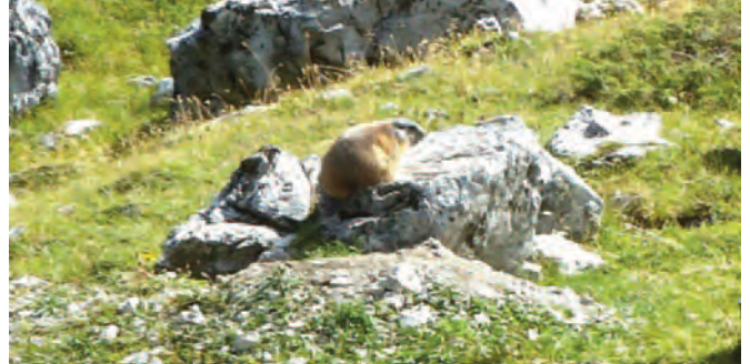
Auf der Wanderung gesehen: Murmeltier nimmt Sonnenbad

Auch die Gegend war unbestritten schön; vom Ofenpass aus über eine Hochebene durch das landschaftlich einmalige Val Mora zurück nach Valchava, sieben Stunden lang. Unterwegs trafen wir Murmeltiere beim Sonnenbaden. Am Abend suchten einige mit Hilfe des Lagerhaus-Vermieters – ein Jäger – Steinböcke entlang des höchsten Passstrasse der Schweiz, dem Umbrailpass. Leider vergebens, der Sommer war warm, die Steinböcke deshalb höher in den Bergen, dafür gab es einen Abstecher nach Italien.