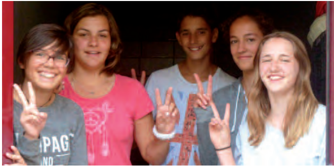
Gute Stimmung im Lagerhaus

Jährlich findet an der Sekundarschule Flaachtal in der zweiten Woche nach den Sommerferien die Sonderwoche statt. Die Idee dahinter: Wenn bei den Schülerinnen und Schülern der 1. Sek die Einführung in die Informatik und die Lerntechnik, das Klassenlager der 2. Sek und bei den Drittklässlern Schulreise, Sexualkunde und Schuldenprävention in derselben Woche stattfinden, lässt sich alles besser organisieren, weil alle gleichzeitig einen besonderen Stundenplan haben.