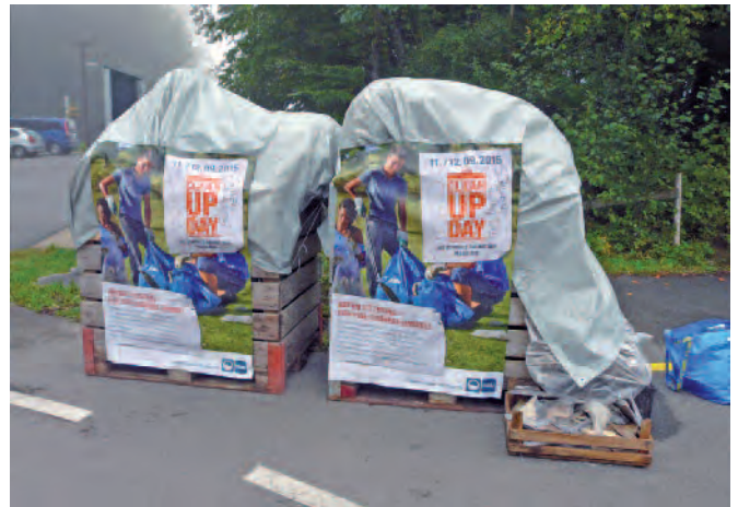
Zwei übervolle Kartoffelballoxe «plus» .... Alle fünf Schuleinheiten des Flaachtals haben diesen Güsel am Freitag gesammelt!