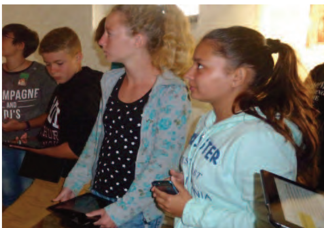
Einsatz der iPads während der Klosterführung

Ein Abenteuer mehr im Lebensrucksack und «etwas geschafft» hatten am Abend des zweiten Tages selbst diejenigen, die Wandern nicht so toll finden.