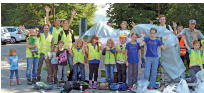
50 FlaachemerInnen haben am Samstag tatkräftig in und um die Thurauen aufgeräumt!