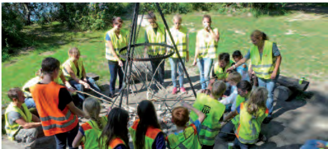
Gemütlicher Ausklang bei Schlangenbrot und Wurst.