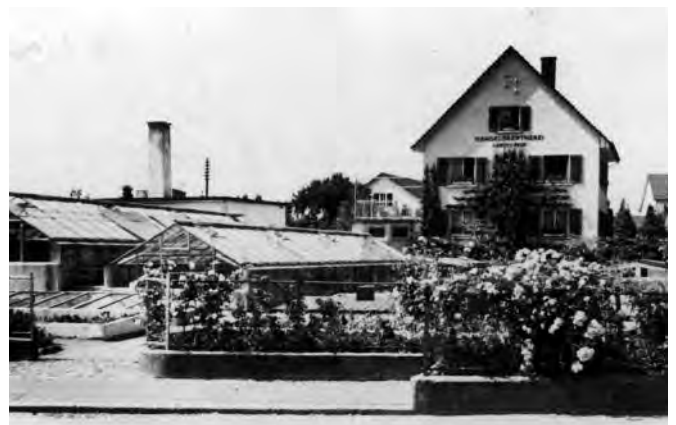
Handelsgärtnerei J. Kretz-Fehr